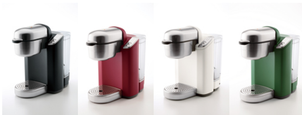
カーボンブラック